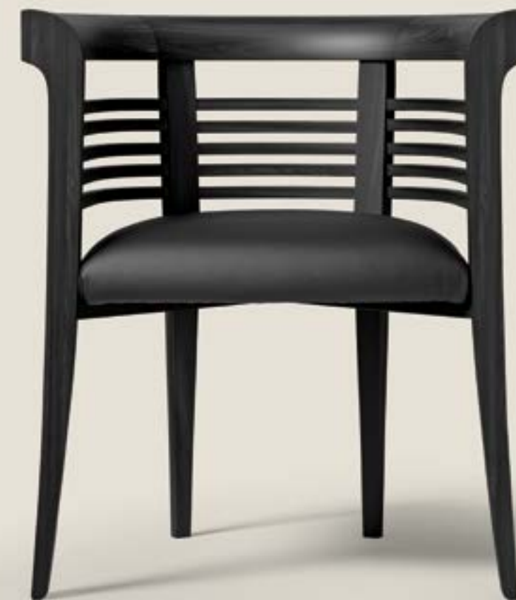
Dolphin Armchair Design by Geo Carignani, Luca Cotini

Salone del Mobile. Milano 16 - 21 aprile 2024 Hall 15, H16