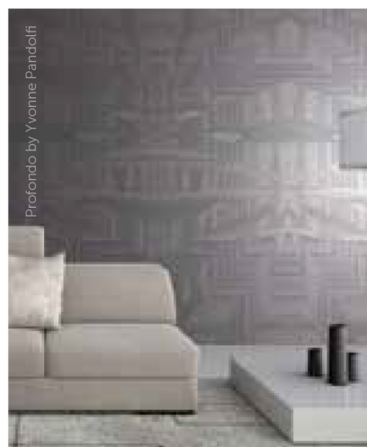
Profondo by Yvonne Pandolfi