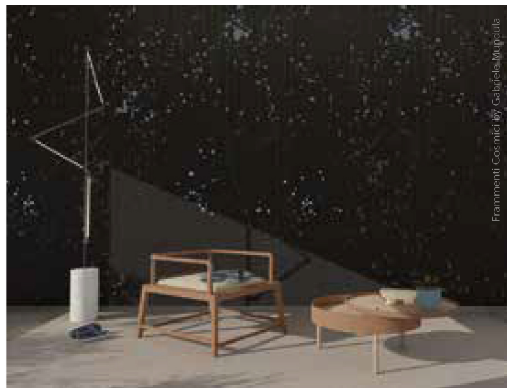
Frammenti Cosmici by Gabriele Mundula