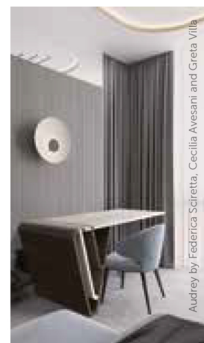
Audrey by Federica Sciretta, Cecilia Avesani and Greta Villa