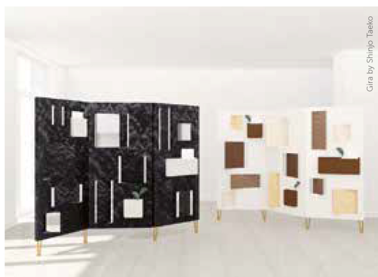
Gira by Shinjo Taeko